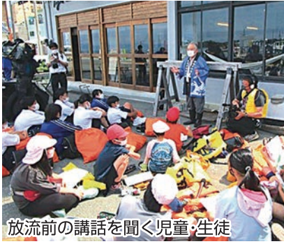
放流前の講話を聞く児童、生徒

また今年に関係者の他、3年振りに地元戸田小中一貫校の児童及び生徒が参加し、放流を行いました。