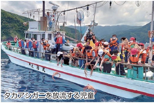
タカアシガニを放流する児童

事業の実施にあたっては、地元飲食店等の会員事業所や地元漁業関係者の方々から多くのご協賛やカニのご寄付をいただいております。新型コロナウイルスによる影響が続く上に、昨年から続く記録的なカニの不漁の中、ご協賛いただきました誠にありがとうございます。この場を借りて厚く御礼申し上げます。皆様からの多大なご協力により、戸田地区の子供たちに貴重な体験をしていただくことができました。